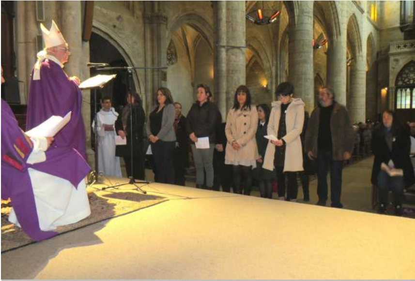
Appel Décisif Notre-Dame de Marmande

Le 1er dimanche de Carême, l'évêque rassemble les catéchumènes et la communauté chrétienne pour l'Appel Décisif. C'est une étape importante vers le baptême.